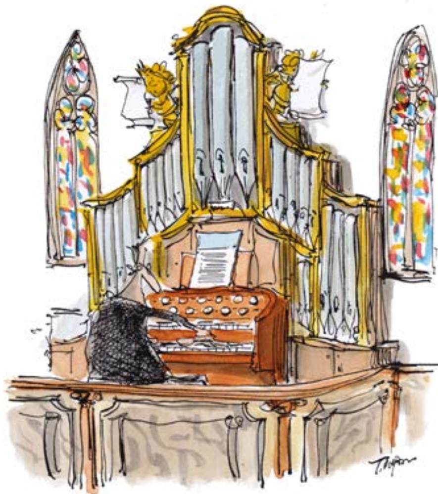
Karikatur: Thomas Plaßmann

Bei alledem soll eine weitere, prekäre Situation nicht unerwähnt bleiben. Viele wertvolle Orgeln sind oft niedrigen Temperaturen oder unheilvollen Temperaturschwankungen in den Kirchen ausgesetzt. Mir ist auch bewusst, dass nicht mehr in jeder Kirche, in der eine Orgel aufgestellt ist,