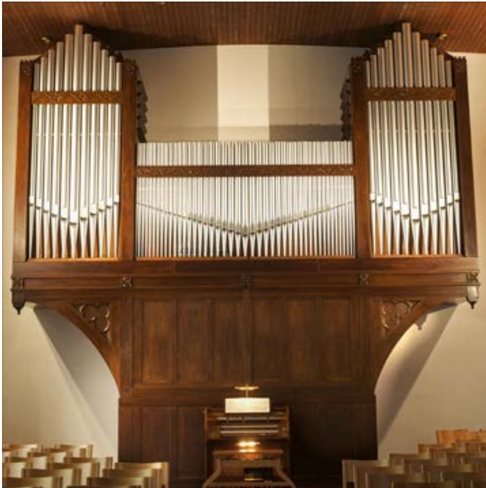
Orgel in der Kirche in Wilwerwiltz

nisterin Tanson veranlasst, sich diesem Problem zu widmen. Insbesondere ein neues Gesetz, die „Loi du 25 février 2022 relative au patrimoine culturel“, bietet dem Staat die Möglichkeit, sich am Erhalt wertvoller Objekte zu beteiligen. Dieses Gesetz zielt darauf ab, die Kriterien für die Aufnahme eines bestimmten Objekts, sei es Immobilie oder Mobiliar, in den Denkmalschutz festzulegen und die entsprechende Prozedur zu regeln. Es legt zudem die Verpflichtungen von Besitzern und Staat gegenüber denkmalgeschützten Objekten fest.