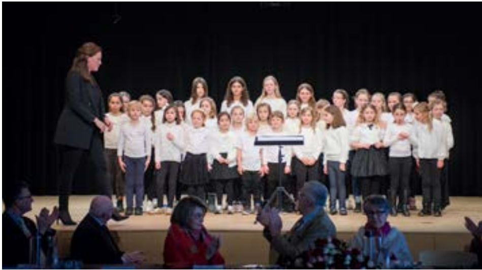
De Kannerchouer "Hueflachspatzen"

nutt ass un déi 73 Aktiver erënnert ginn, déi am leschte Joer verstuerwe sinn.