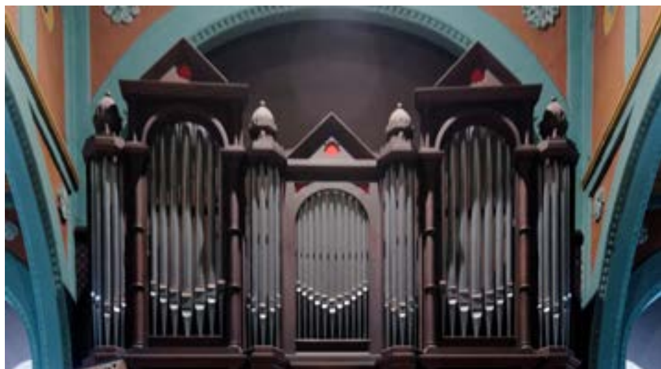
Orgel in der Pfarrkirche Paffenthal

Am 13. Februar 2018 schauten die rund 250 Kirchenorgeln des Großherzogtums Luxemburg einer ungewissen Zukunft entgegen. An diesem Tag unterzeichnete Staatschef Großherzog Henri auf Schloss Berg jenes Gesetz, das die Schaffung eines Fonds zur Verwaltung kirchlicher Besitztümer besiegelte und den Gemeinden die Möglichkeit nahm, sich am Unterhalt der im Besitz der Kirche befindlichen Güter, einschließlich Immobilien und Mobiliar, zu beteiligen (Loi du 13 février 2018 portant sur la gestion des édifices religieux et autres biens relevant du culte catholique, ainsi que sur l'interdiction du financement des cultes par les communes ; dite loi „Kierchefong“). Wenn eine Kirche dagegen durch die Trennung von Kirche und Staat in den Gemeindebesitz überging und die