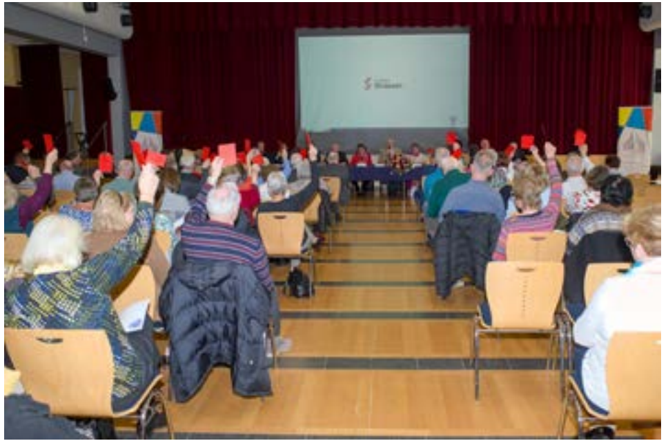
Ofstëmmung iwwer d'statutaresch Berichter