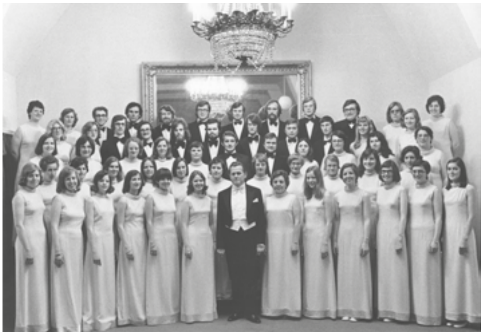
Chorale Jong Lëtzebuerg