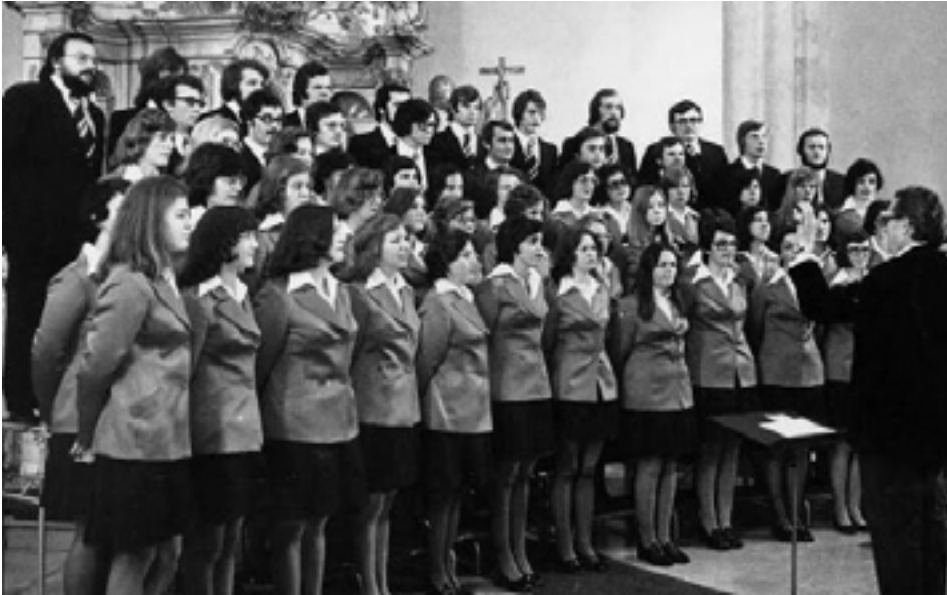
D'Chorale Jong Lëtzebuerg an der Mechelskierch