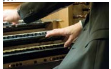
Improvisatioun mat 2 Hänn op 3 Clavieren; d'Uergel um Houwald huet leider keng 4