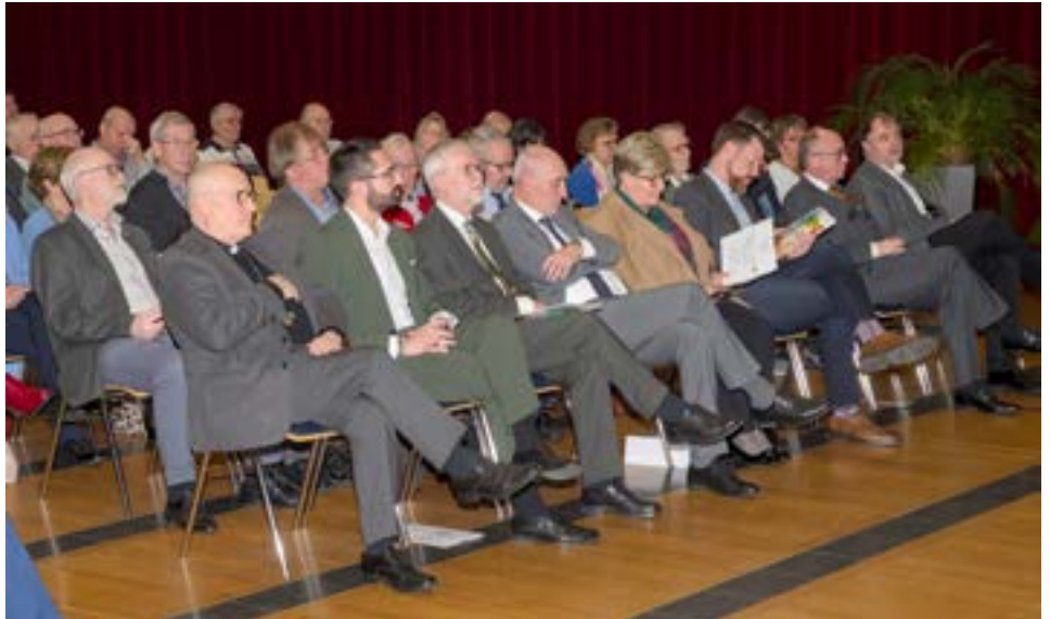
En Deel vun den Éieregäscht a Veräinsdelegéierten